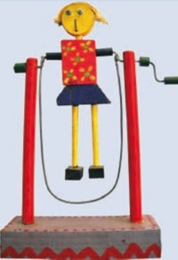
Muñeca artesanal de madera, comprada en un museo de Buenos Aires, en mayo de 2000.