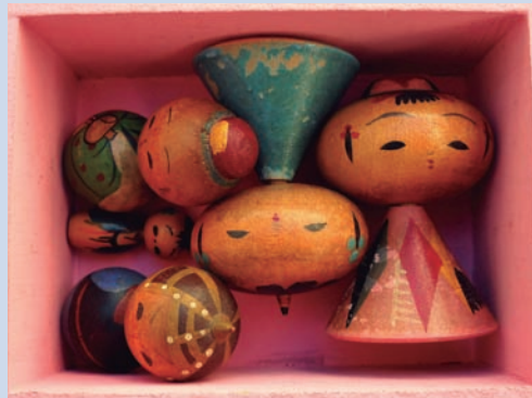
Muñecas japonesas en caja de madera, de la infancia de la coleccionista.

Proponemos diseñar la exposición en pequeños grupos, siguiendo algunos pasos importantes: