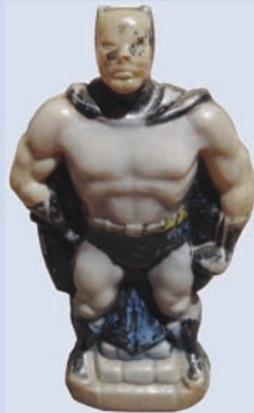
Alcancía de plástico, juguete de la infancia.