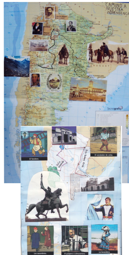
Actores sociales de nuestra Independencia

En congreso inició sus sesiones en el mes de marzo y leugo de amplios deba-