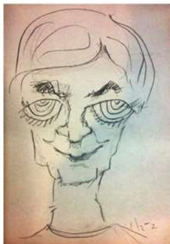
Maria Elena Walsh.