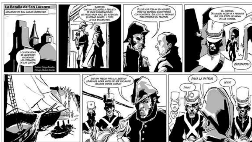
Historieta sobre José de San Martín: La Batalla de San Lorenzo. Visitas virtuales en 360º de los principales museos del general San Martín. Disponible en: https://www.educ.ar/noticias/200010/visitas-virtuales-en-360ordm-de-los-principales-museos-del-general-san-martiacuten

Te contamos que el cacique Tehuelche Patoruzú, fue el héroe de caricatura más famoso de nuestro país. De una gran moral inquebrantable, retrató costumbres argentinas, llegando a vender trescientas mil revistas semanales. Fue creado por Dante Quintero y apareció públicamente el 19 de octubre de 1928. Años atrás, entre los grandes protagonistas del comic mundial, Patoruzú con características criollas, se convirtió en un gran héroe en nuestro país como era Superman es en los Estados Unidos, Asterix en Francia y Astroboy en Japón. (Redacción Diario De Cuyo 23-11-2018 https://www.diariodecuyo.com.ar/columnasdeopinion/Los-90-anos-delcacique-Patoruzu-20181122-0110.html )