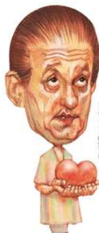
René Favaloro: https://www.pinterest.es/pin/46295603666872346/