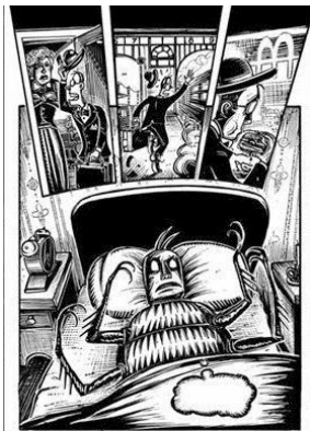
Comic de La metamorfosis de Kafka por Peter Kuper

Pero no podemos olvidar transformaciones como la del gran conde Drácula, un hombre convertido en vampiro; la del hombre – lobo; o la Metamorfosis de Franz Kafka en la que el protagonista se transforma en insecto. Este tema, también nos lleva a pensar en transformaciones a partir de experimentos, como es el caso del Hombre invisible de H. G. Wells o del temible Dr. Jekyll de la novela El Dr. Jekyll y Mr. Hyde de Robert Louis Stevenson.