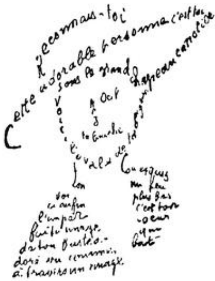
Poema de 9 de febrero de 1915 de Guillaume

Los Calligramas son una idealización de la poesía de verso libre y de la precisión tipográfica, en una era en que la tipografía está alcanzando un brillante final en su carrera, por la llegada de nuevos medios de reproducción, como el cine y el fonógrafo Guillaume Apollinaire, en una carta a André Billy https://es.wikipedia.org/wiki/Caligramas_(Apollinaire)