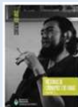
Historias de cronopios y de famas (fragmentos)