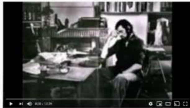
Casa Tomada - Voz de Julio Cortazar

https://www.youtube.com/watch?v=uGGOv3t3BMo