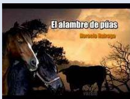
El alambre de púa