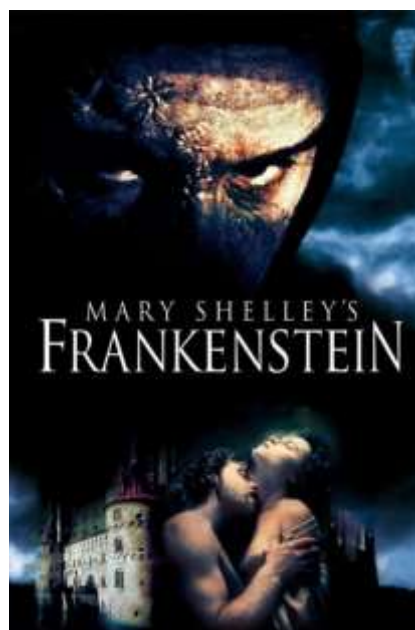
Frankenstein de Mary Shelley de K. Branagh