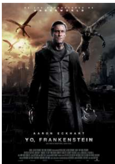
Yo, Frankenstein de Stuart Beattie