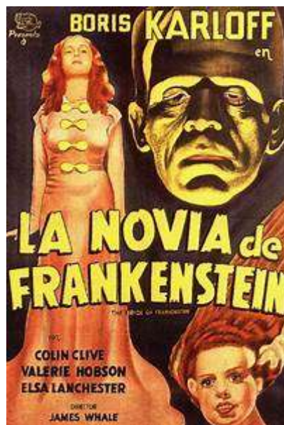
La novia de Frankenstein de James Whale