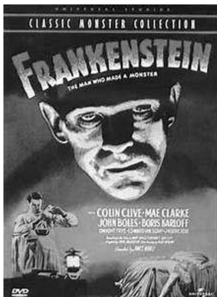
Frankenstein de James Whale