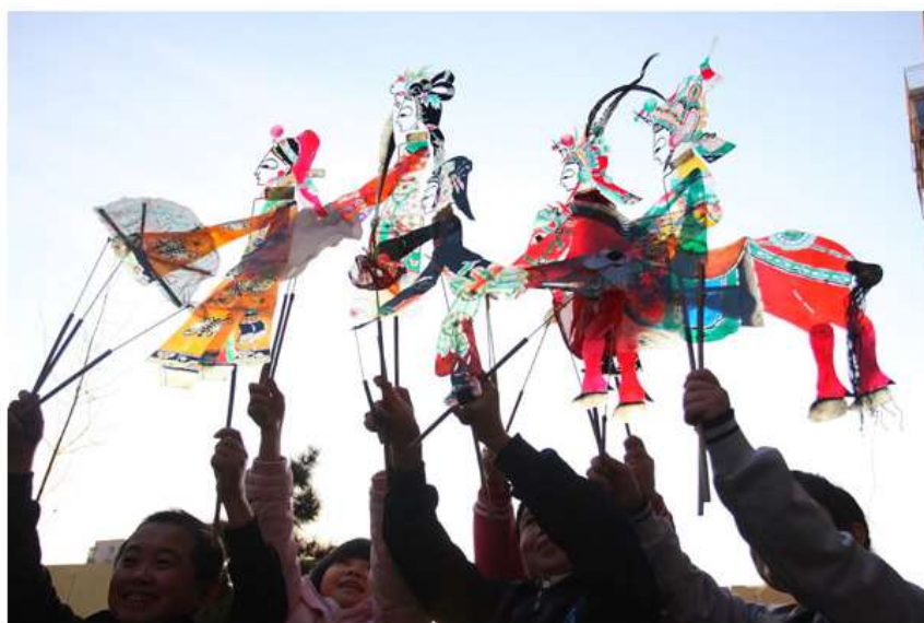
El grupo de titiriteros "Hormiguitas".