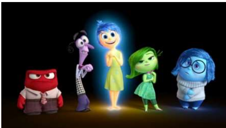
Imagen de la película Intensa-Mente. (2015). Producida por Pixar Animation Studios y distribuida por Walt Disney Pictures.

Esta imagen corresponde a una película: Intensa-Mente, de Disney - Pixar que quizás hayas podido ver, donde se encuentran presentes las cinco emociones : sorpresa, temor/miedo, alegría, tristeza, furia/ira.