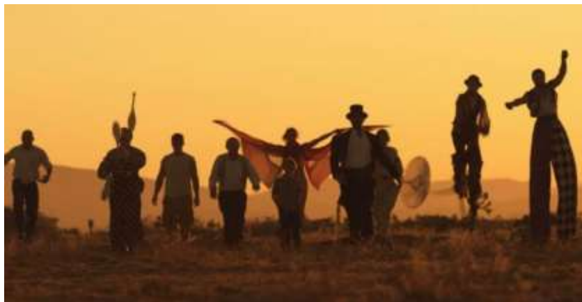
Imagen recuperada de https://buenavibra.es/movida-sana/psicologia/el-circo-de-la-mariposa-para-desplegar-alas-hay-que-decidir-hacerlo/

A. Observa la película “El Circo de las mariposas” en el sig. link de You Tube https://www.youtube.com/watch?v=od2lg1ZC20s