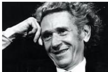
Juan José Arreola - México

Luego, compartilos con tu familia. Comenten juntos lo que les transmiten. Si te gustaron, podés googlear a los autores y buscar más textos para compartir.