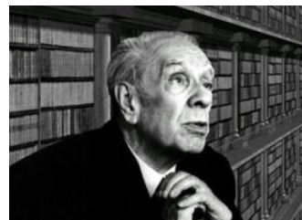
Un sueño de Jorge Luis Borges – Argentina

La mujer que amé se ha convertido en fantasma. Yo soy el lugar de sus apariciones. (En: "Narrativa completa")