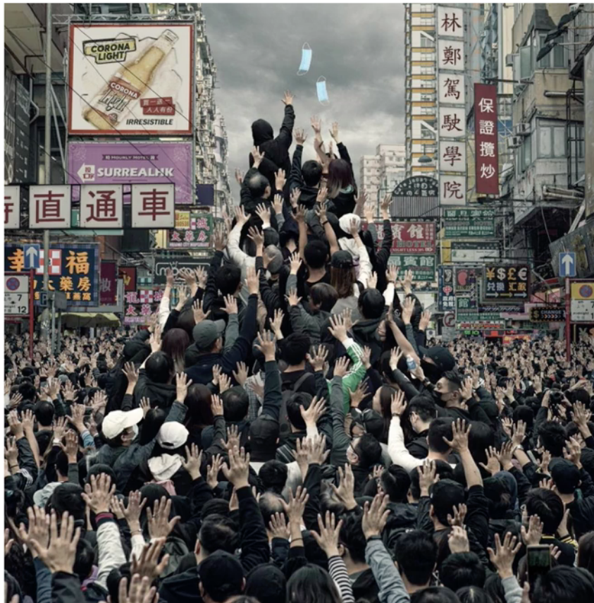
Artista: Tommy Fung

A partir de las imágenes propuestas a continuación, argumenten la relación entre ambas.